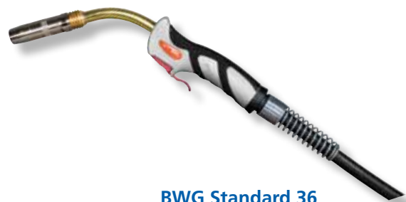
BWG Standard 36

Leistungsbereich Mischgas M21 (z.B. Igumix 18) ca. 290A/60% ED, bei CO 2 ca. 320A/60% ED Empfohlener Gasdurchfluß ca. 8-16 l/min