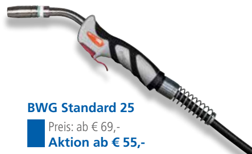
BWG Standard 25