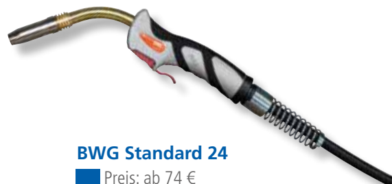
BWG Standard 24

Leistungsbereich Mischgas M21 (z.B. Igumix 18) ca. 200A/60% ED, bei CO 2 ca. 230A/60% ED Empfohlener Gasdurchfluß ca. 8-16 l/min