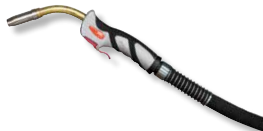
BWG Standard 240

Leistungsbereich: ED 100%, Mischgas M21 (z.B. Igumix 18) 300A, Co 2 325A