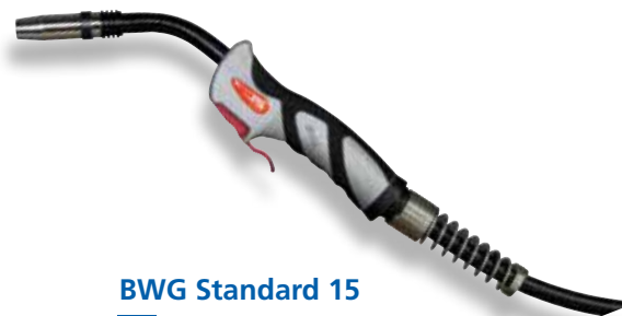
BWG Standard 15

Leistungsbereich Mischgas M21 (z.B. Igumix 18) ca. 150A/60% ED, bei CO 2 ca. 180A/60% ED empfohlener Gasdurchfluß ca. 8-12 l/min